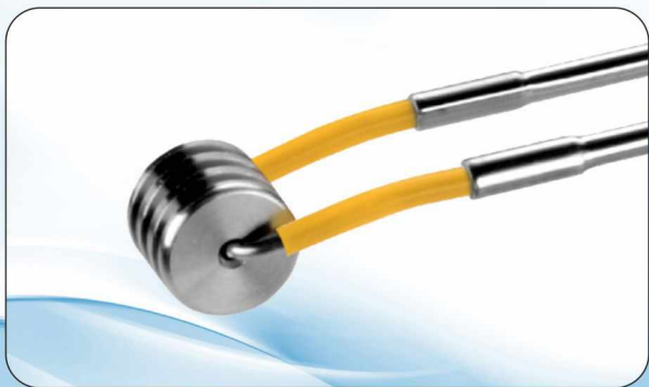
Elektrody do elektrowaporyzacji gruczolaka stercza