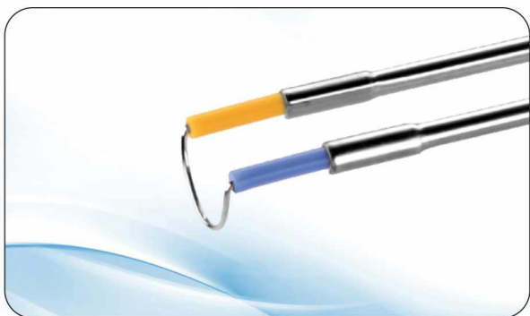
Elektrody do elektroresekcji gruczolaka stercza