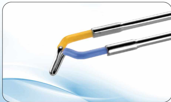
Elektrody do elektronacięcia gruczolaka stercza